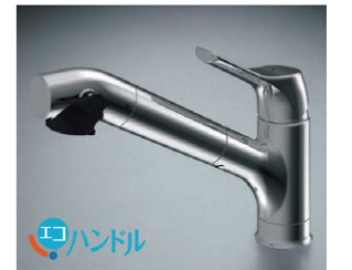
オールインワン浄水栓DSタイプ・エコハンドル JFAD461SYXJG5D