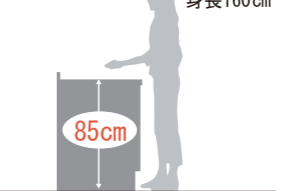
ワークトップのおすすめ高さは、身長(cm)÷2+5cmが目安です。