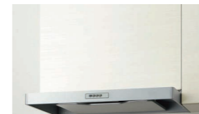
別売品:化粧パネル・金属幕板 (写真は化粧パネルです。)