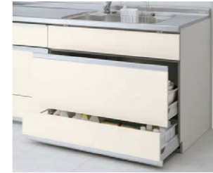
スライドストッカー