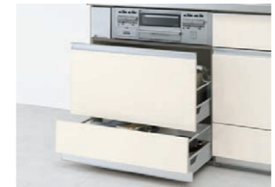
※2ロコンログリルなし用タイプもご用意しています。 スライドストッカー