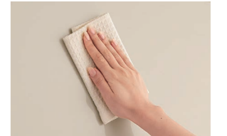
※長くお使いいただくために、やわらかい布でお手入れしてください。

※各写真・イラストはイメージです。見積内容とは異なる場合がありますので、ご注意ください。