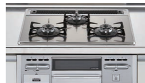
フェイス:シルバー | トップ:シルバー