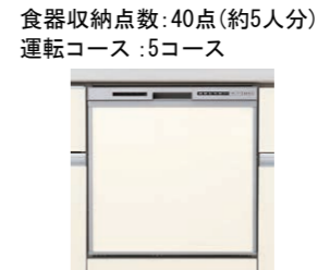
浅型タイプ(パネル材仕様) NP45RS6SJCD