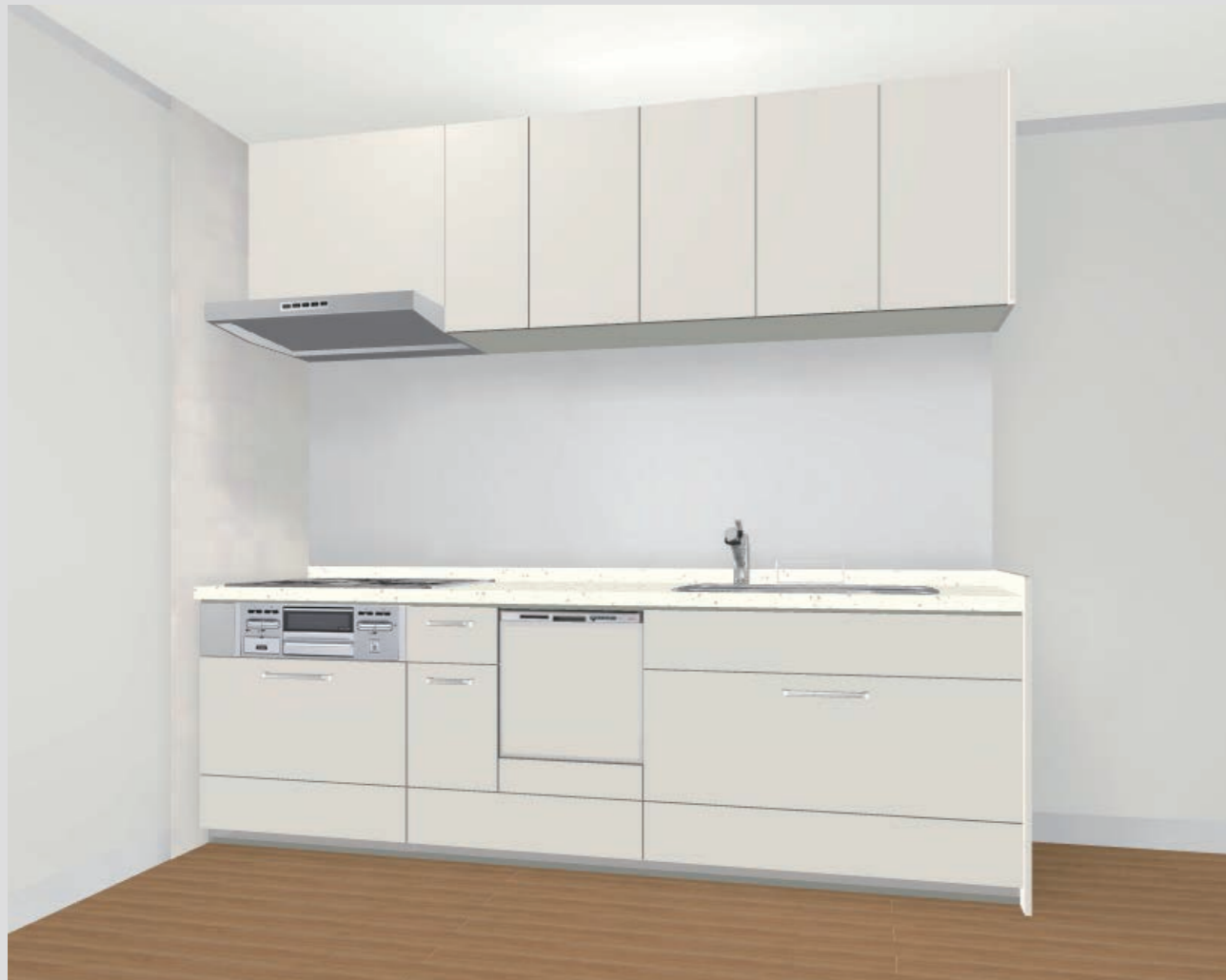
CG合成によるイメージ画像です。 現場調達品、シリーズ外選定品に関しては表現しておりません。